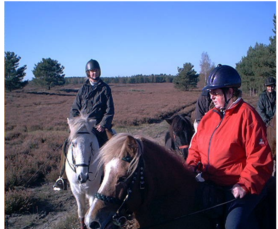
kleiner Zwischenstopp in der Heide

Der IPZV Lüneburger Heide wünscht seinen Mitgliedern ein schönes Weihnachtsfest und einen guten Rutsch ins neue Jahr!