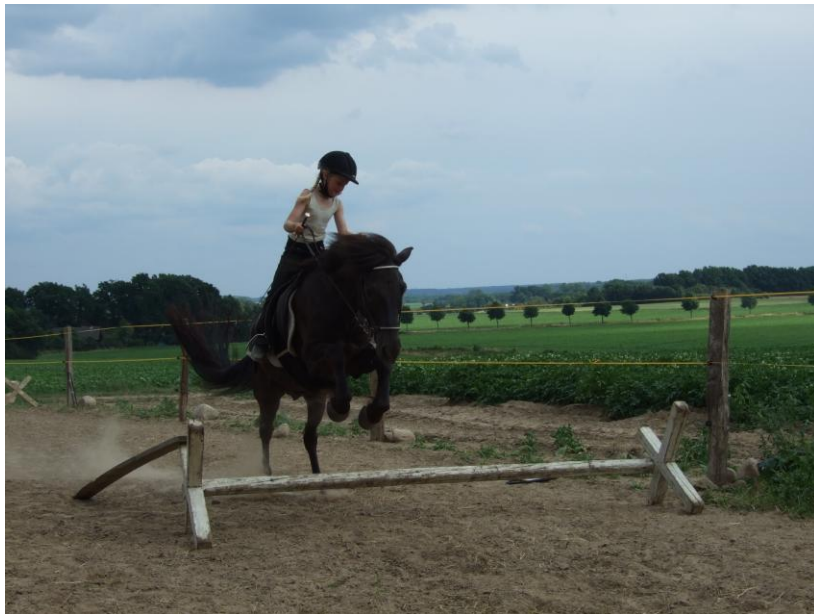
Kinderreitkurs in Rieste