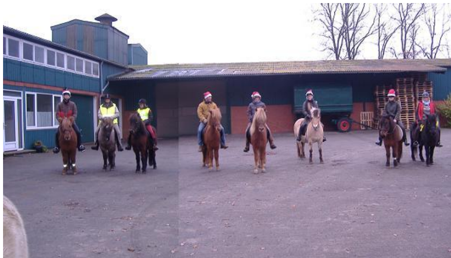
Nikoläuse, Islandpferde und Rentiere bereit zum Abritt